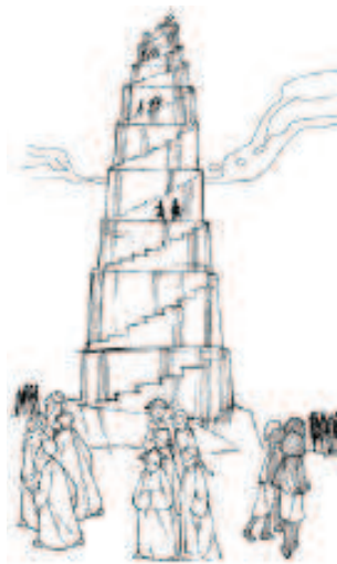
La Torre de Babel (Gén 11),