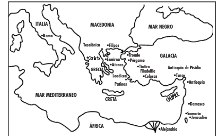
El Mapa de los pueblos (Gén 10),